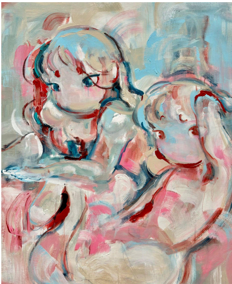
오코쿠메, Complicidad en silencio(Complicity in Silence), 2024, Acrylic on canvas,101x83cm