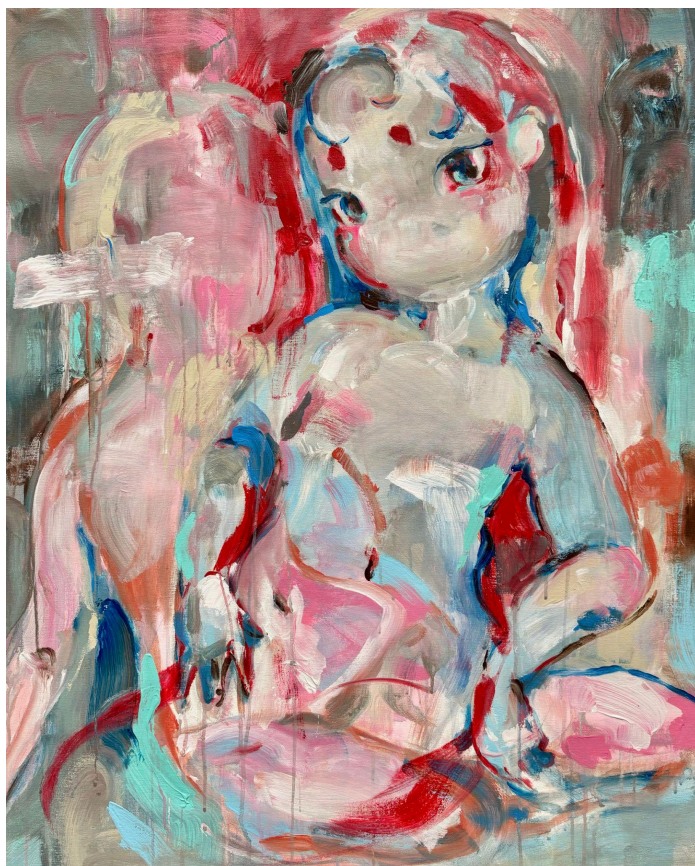
오코쿠메, Huella emocional(Emocional Trace), 2024, Acrylic on canvas, 101x83cm © Okokume

오코쿠메의 작품은 수년간 다양한 문화를 흡수하고 교감하면서 형성된 내면의 성장을 반영한다. 특히 한국 문화와의 오랜 인연은 그녀의 예술 활동에 풍부한 영감을 주었다. 8년 전 한국을 처음 방문한 오코쿠메는 한국의 전통, 역사와 현대의 조화로운 공존, 한지와 같은 재료의 섬세한 아름다움에 깊은 감동을 받았다. 이번 레지던시 프로그램을 통해 그녀는 한국의 유산에 뿌리를 둔 고요한 색감과 질감이 어우러진 작품을 제작하였다.